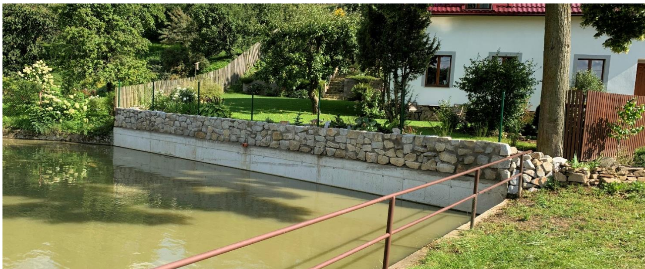
Stabilizace svahu návesního rybníku ve Vračkovcích.