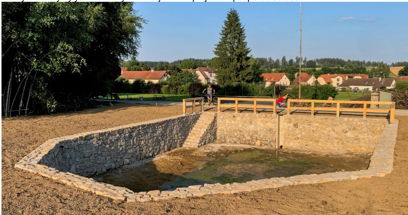
„Kaberna“ v Horní Lhotě