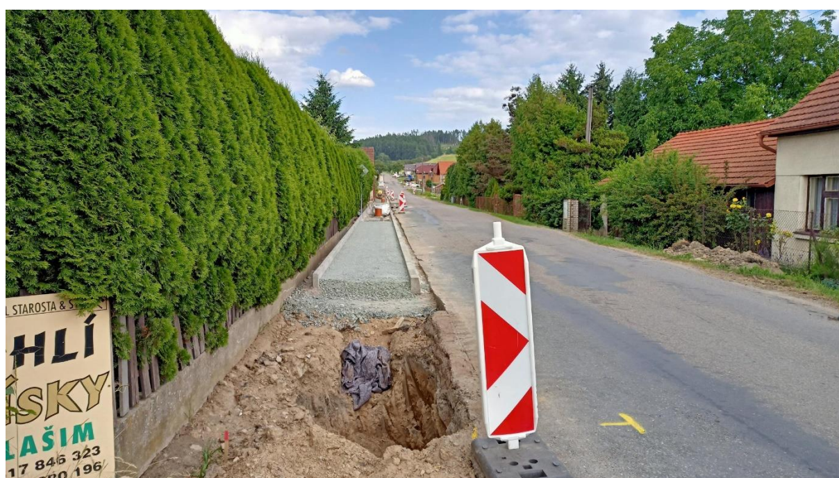
V červnu pokračovala výstavba chodníku v ulici Lhotecká.