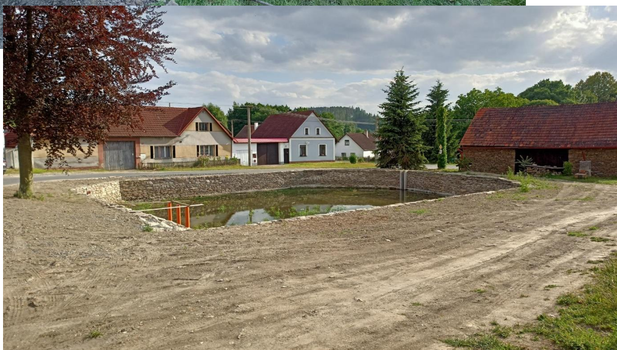
Nádrž v Pravěticích