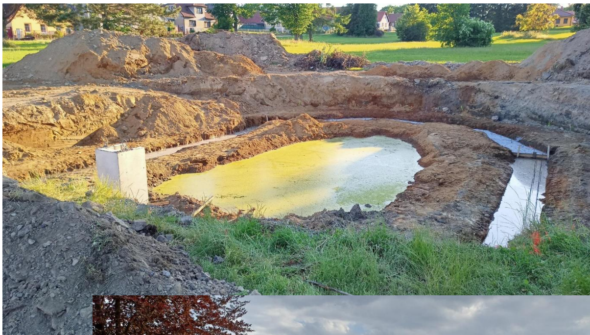
Nádrž v Horní Lhotě