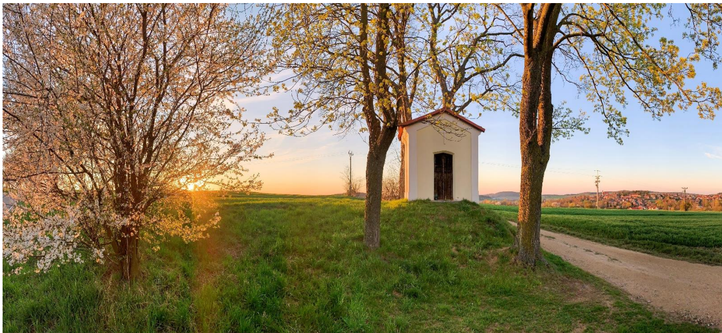
Kaplička sv. Tadeáše (u silnice směr Načeradec - Daměnice)