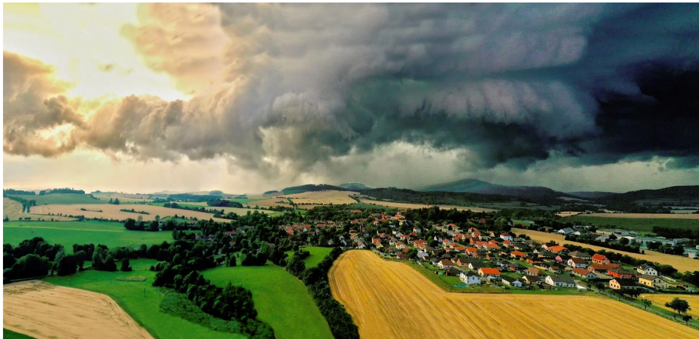
Červencová bouřka s krupobitím nad Načeradcem