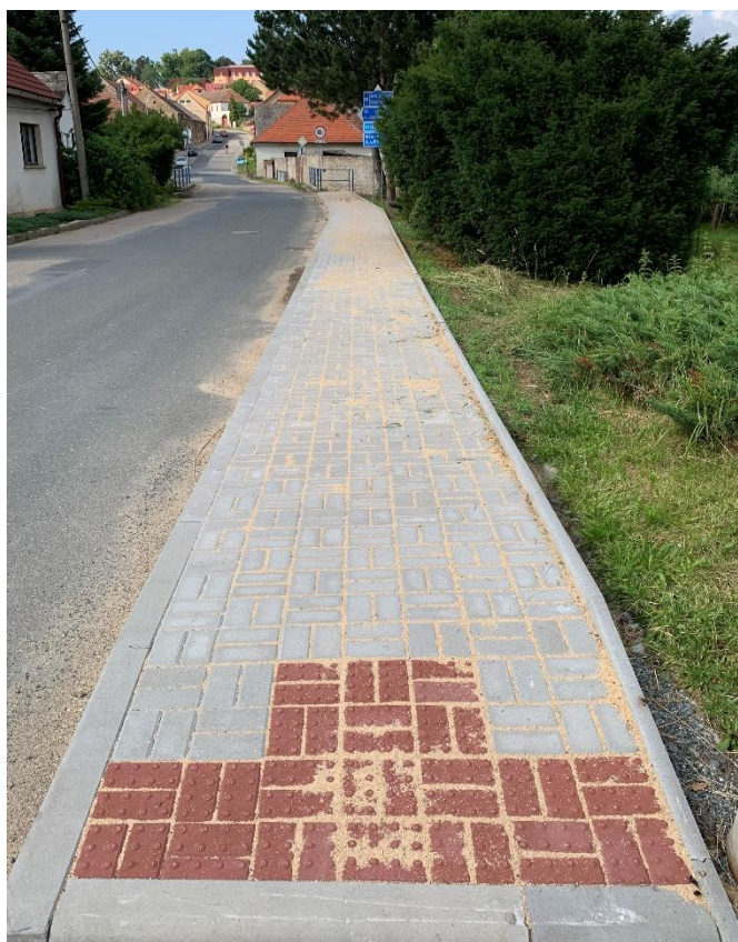
Byla dokončena stavba chodníku v ulici Vožická od mostku přes potok Brodec k zatáčce „U Ryšavých“. Chodník je naplánovaný do budoucna až na konec obce směrem na Daměnice.

Stav finančních prostředků k 30.06. 2022: