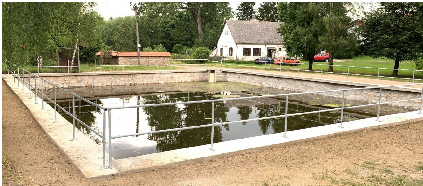
Byla dokončena rekonstrukce malé vodní nádrže v Olešné