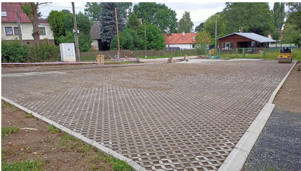
Probíhají práce na zpevněné parkovací ploše v Olešné