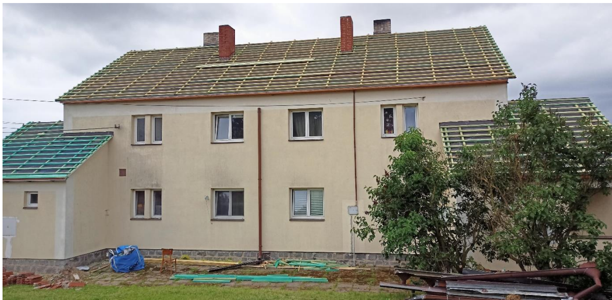
Ve výstavbě je nová střecha na bytovém domě v ul. Panská

RM bere na vědomí informaci o tom, že městys v rámci veřejně prospěšných prací požádal Úřad práce v Benešově v rámci Dodatku č.1 k dohodě o vytvoření pracovních příležitostí o rozšíření na 4 pracovníky.