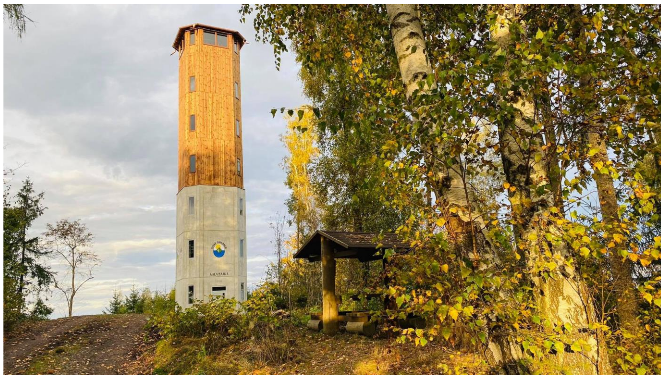
Foto: Nová rozhledna v regionu vyrostla na Javornické hůře.

Koncem měsíce listopadu otevřela své dveře rozhledna na Javornické hůře – Kalamajka. Cesta k rozhledně není tak náročná jako ta na Blaník a nabízí pohled na všechny světové strany do krajiny vzdálené několik desítek kilometrů.