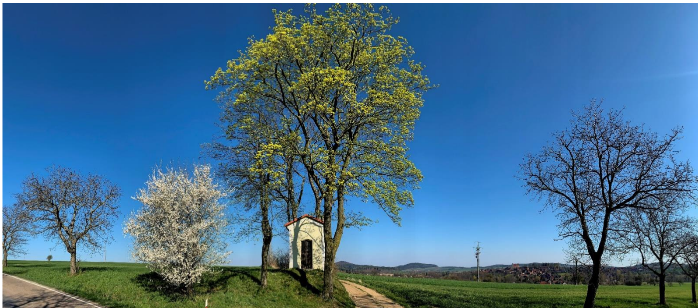
Kaplička sv. Tadeáše u Načeradce