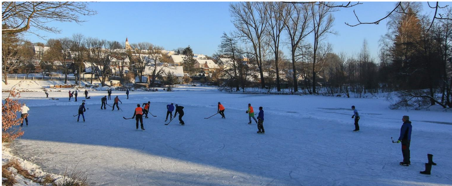
Rybník Podsada Načeradec