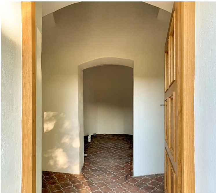
Foto: Vnitřní rekonstrukce kapličky v Pravěticích