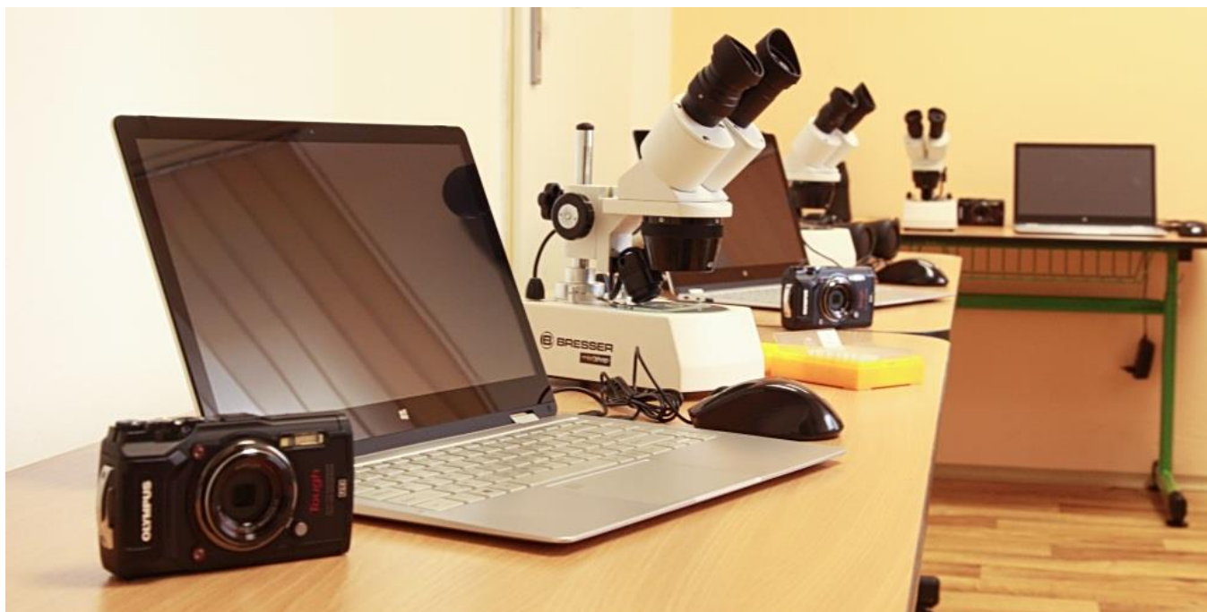
Foto: Vybavení nové biologické laboratoře v ZŠ Načeradec