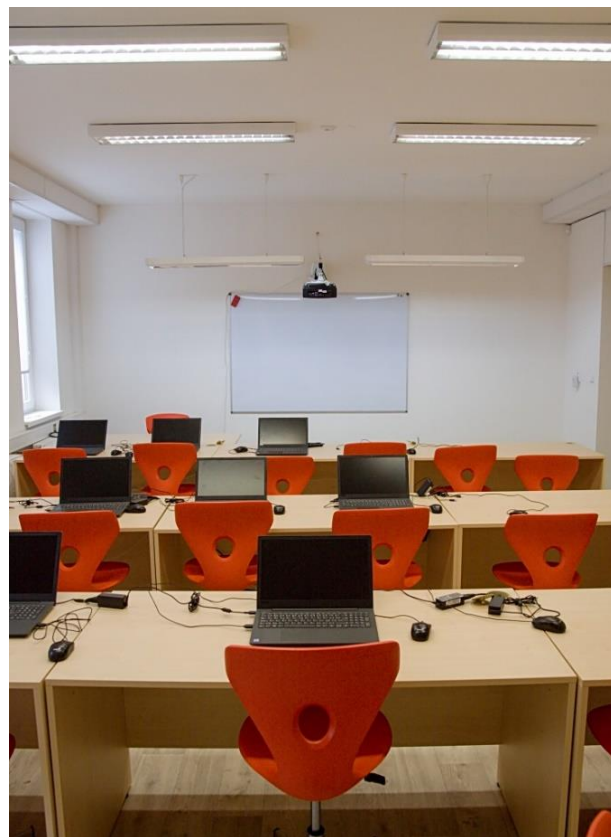
Foto: Vlevo zrekonstruovaná učebna chemie a fyziky, vpravo nová učebna informačních technologií