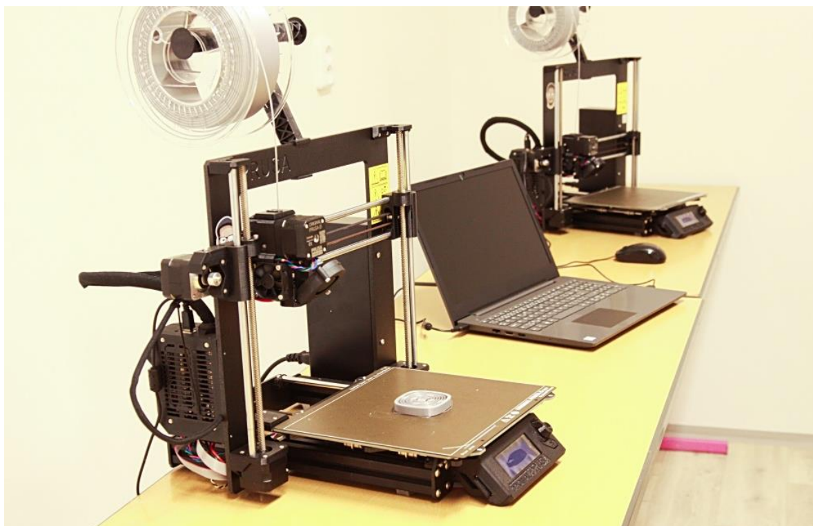
Foto: 3D tiskárny v IT učebně Základní školy Načeradec.