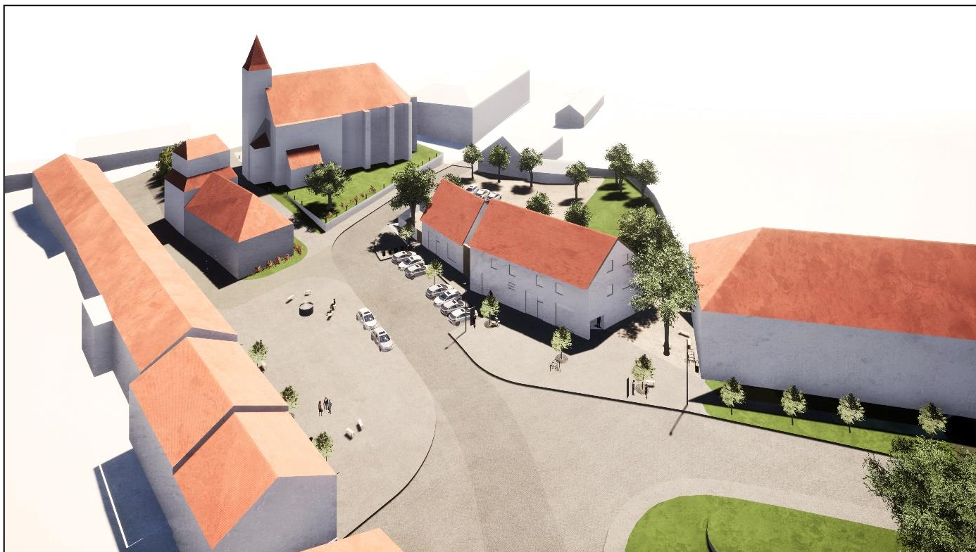
Foto: Vizualizace náměstí ze studie