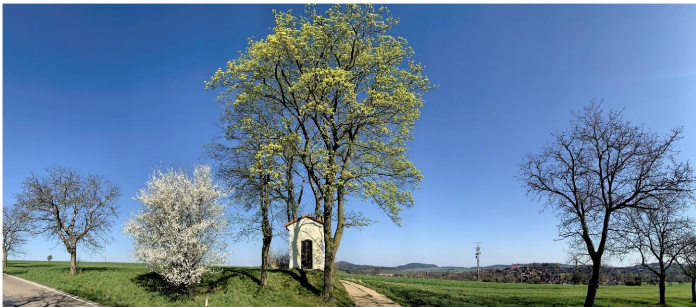
(kaple sv. Tadeáše u Načeradce)