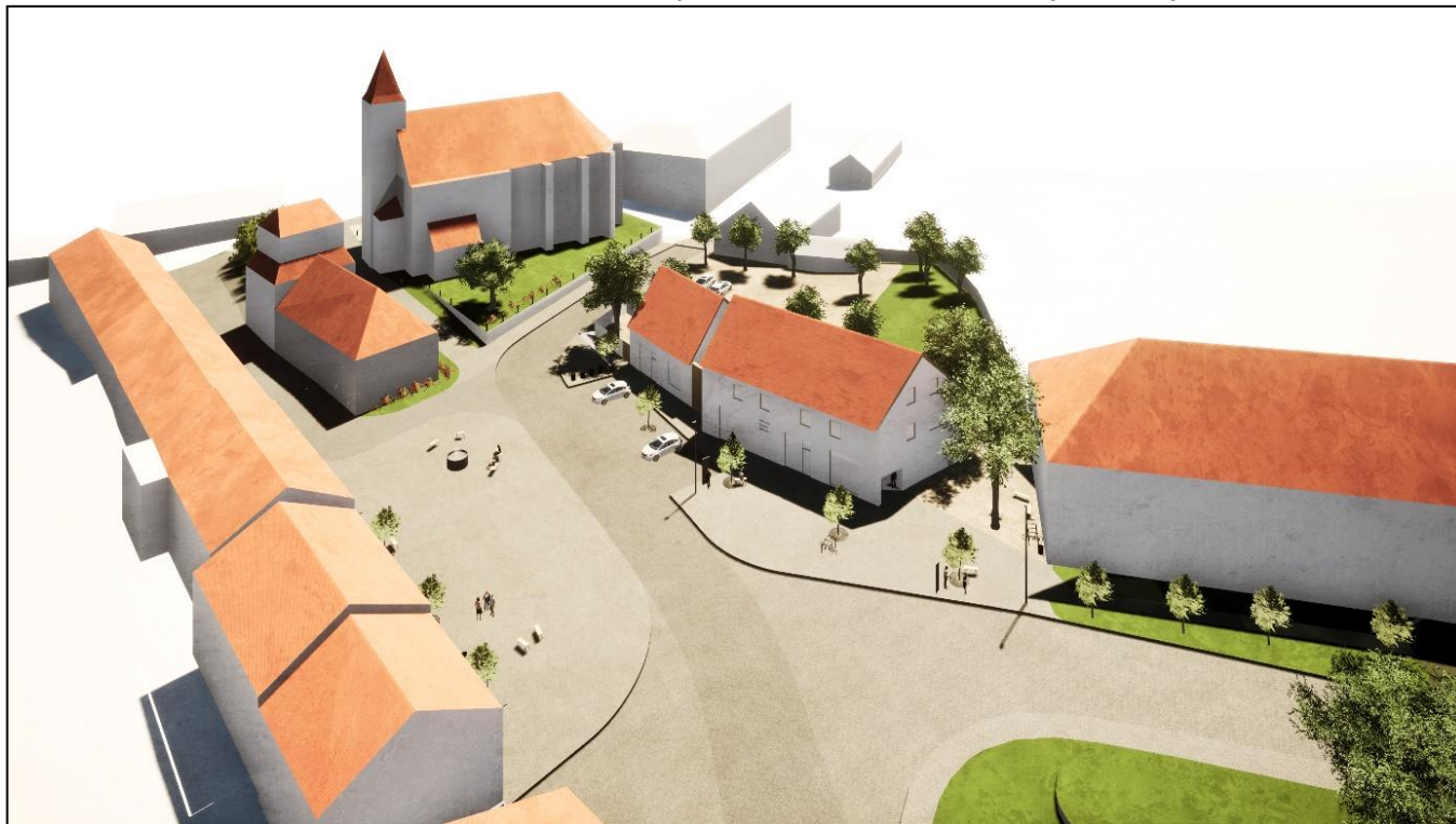
Ukázka vizualizace ze studie.

Závěry posudku na porovnání nákladů za rekonstrukci versus novostavba vyznívají z finančního hlediska i z pohledu realizace opět ve prospěch novostavby místo rekonstrukce stávajícího objektu.