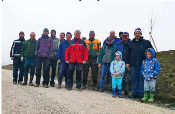
V Horní Lhotě bylo vysazeno 62 stromů.

Městys Načeradec děkuje SDH Horní Lhota, SDH Slavětín, Okrašlovacímu spolku Pravětice a občanům Načeradce, kteří se zúčastnili výsadby listnatých stromů a udělali tak dobrou věc pro své okolí a životní prostředí. Celkem bylo vysazeno 129 stromů, z toho 76 ovocných.