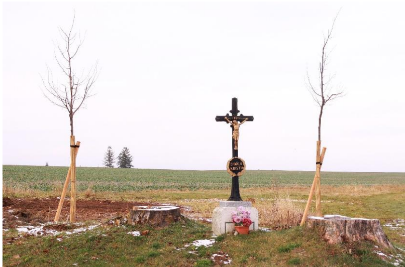
V Říšnici bylo vysazeno 6 stromů.

Stav finančních prostředků k 29.11.2019: