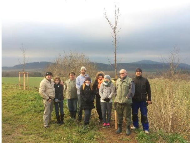
V Načeradci bylo vysazeno 37 stromů.