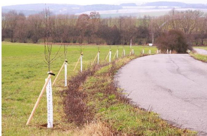
V Pravěticích bylo vysazeno 24 stromů.