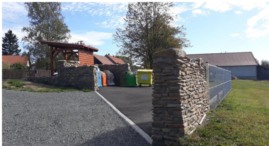
Komplet dokončené odpadové místo a autobusová zastávka v Dolní Lhotě.

Informace: dne 1.10.2019 jsme podali na MZe ČR tři žádosti o dotace (IV. Výzva – podprogram 129 293). „Podpora opatření na rybnících a malých vodních nádržích ve vlastnictví obcí“ - podpory na rekonstrukce, opravy a odbahnění nerybolovných rybníků a malých vodních nádrží za účelem posílení retence a akumulace vody v krajině, za současného zlepšení jejich technického stavu a navrácení základních a vodohospodářských funkcí apod. Městys Načeradec podal žádosti na Retenční nádrž Olešná (koupaliště), Návesník Daměnice a Návesník Řísnice. Na výzvu jsme čekali téměř rok. Vyhodnocení předpokládáme v únoru 2020.